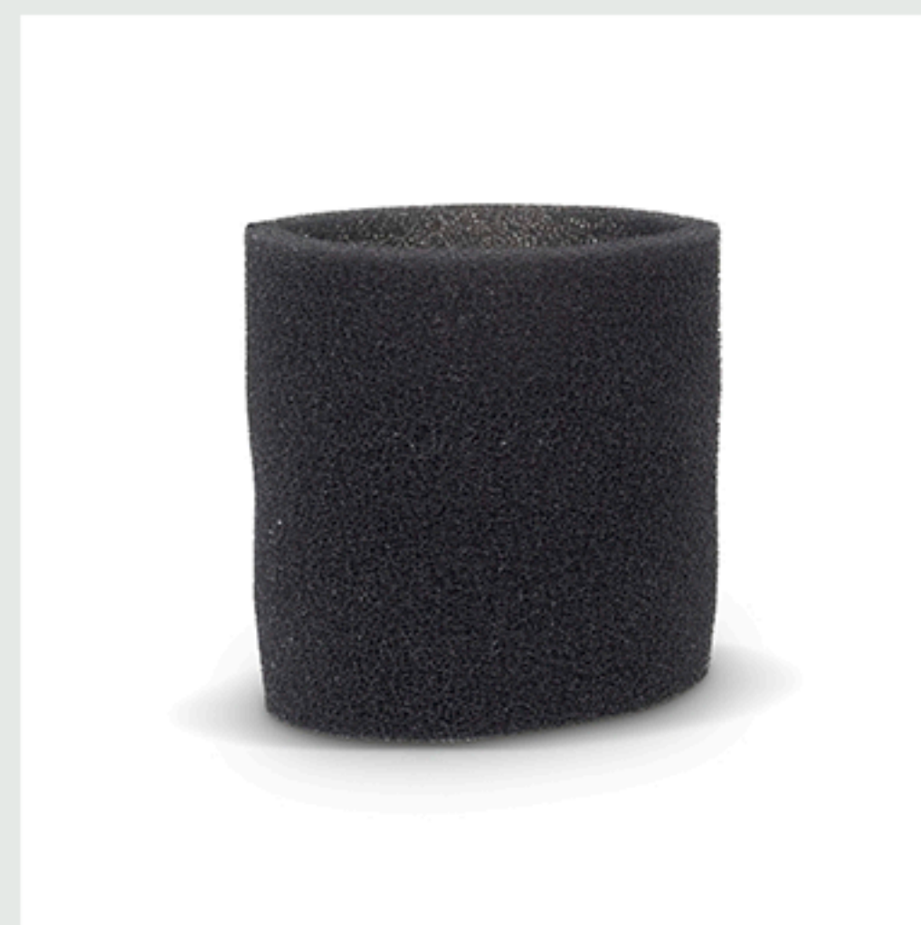
■ Filtro de espuma