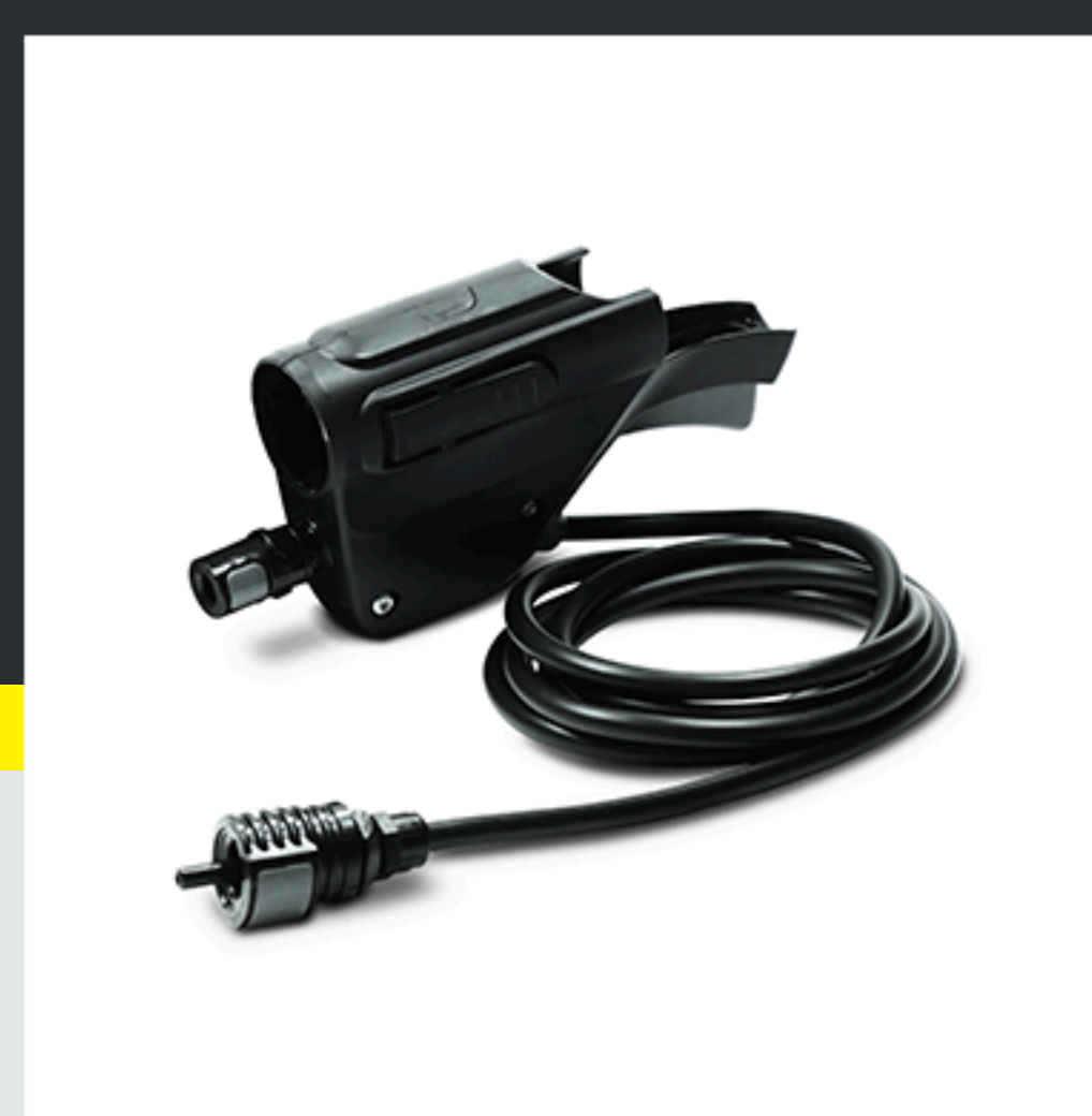
■ Gatillo de pulverización