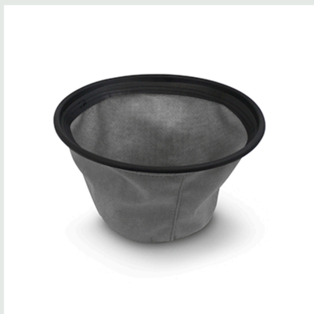
■ Filtro de tela lavable