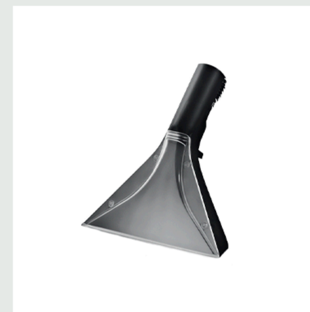
■ Boquilla de extracción para textiles