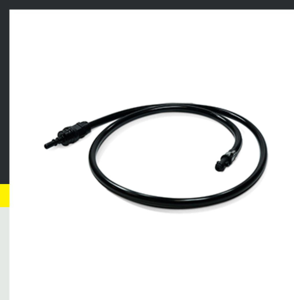
■ Manguera de extensión