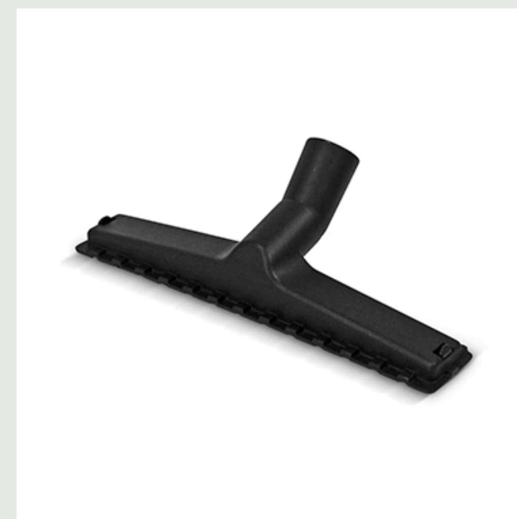
■ Boquilla para suelos