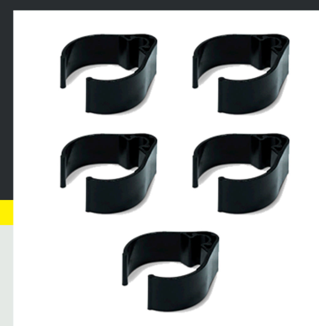
■ Abrazaderas de fijación