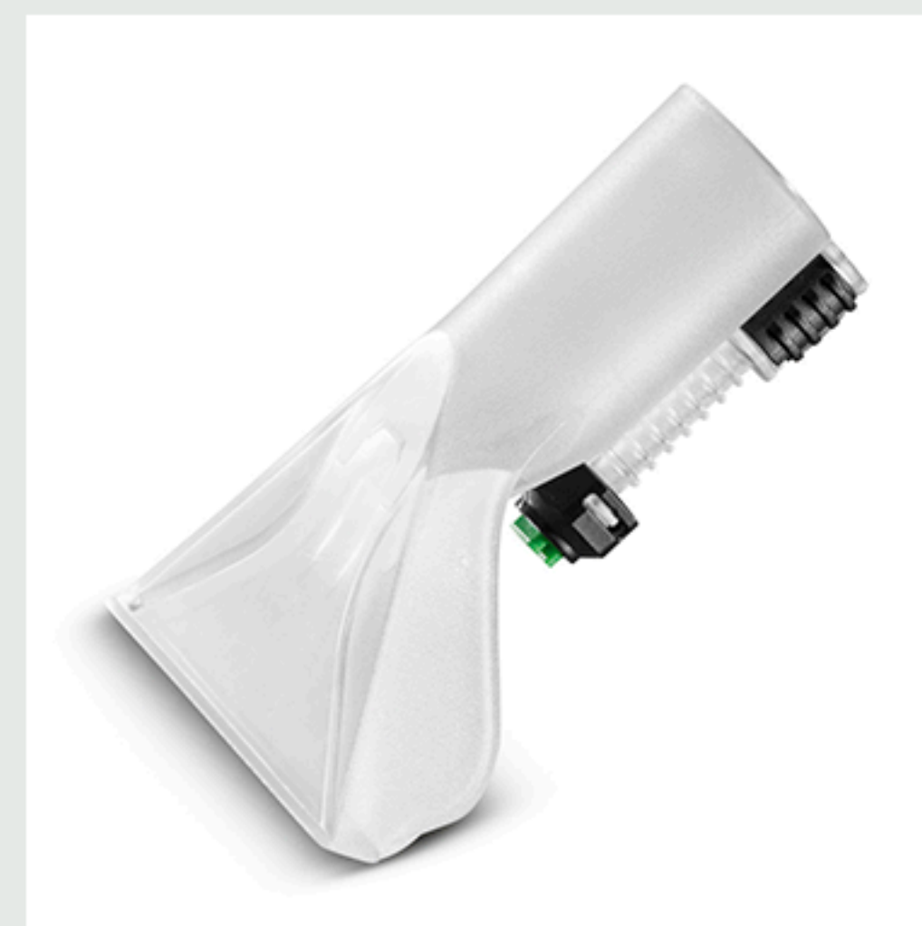
■ Boquilla de mano